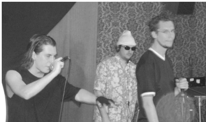
Koncerto de Pafklik' en FESTO 2006