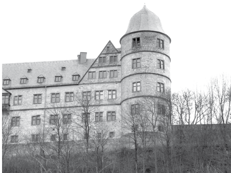
la kastelo de Wewelsburg, kie okazis IS, apud Paderborn