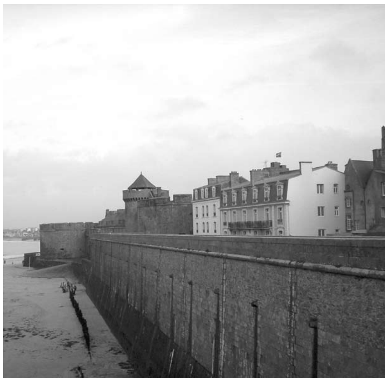
La remparoj de Saint-Malo

Amuza rakonto pri tio: kiam oni donis al mi la informilon, mi tuj demandis, ĉu multaj homoj demandas la esperantlingvan informilon, ŝi anoncis « Mi laboras ĉi tie de nur unu semajno kaj tri personoj petis ĝin, tamen