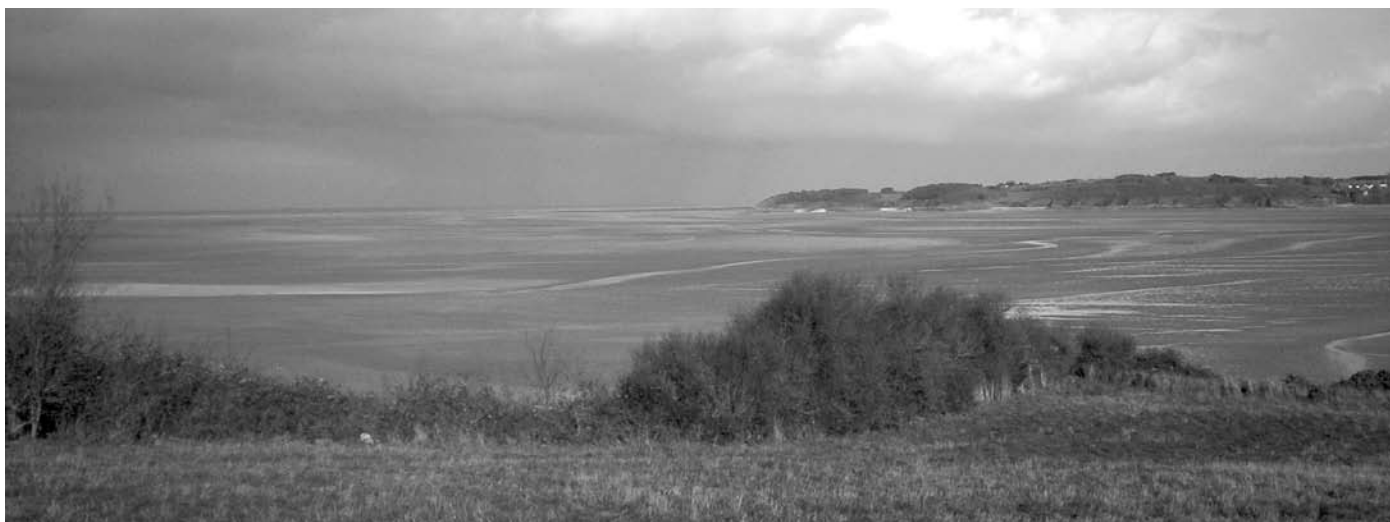
Marbordo apud Saint-Brieuc